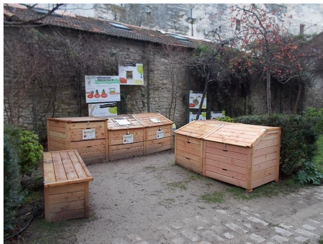
Annexe 2 : Photographie de l'aire de compostage du jardin des Carmes, 1 rue Philippe Cabassole, 84000 Avignon