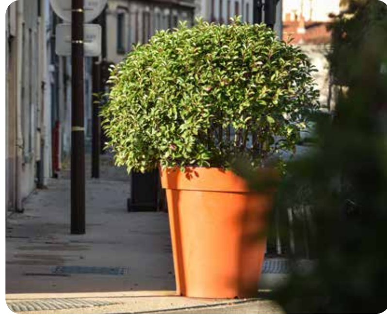
T Brice Théate P Grégory Quittard

Il y a un an, la Ville déployait son Plan Faubourgs avec l'objectif de redonner à la première ceinture un « esprit village ». Tout une série d'aménagements a été ainsi mise en œuvre de façon progressive : apaisement de la circulation, embellissement des parvis d'école, promotion des déplacements doux... Une nouvelle étape est franchie cet automne avec la mise en place d'actions de végétalisation.