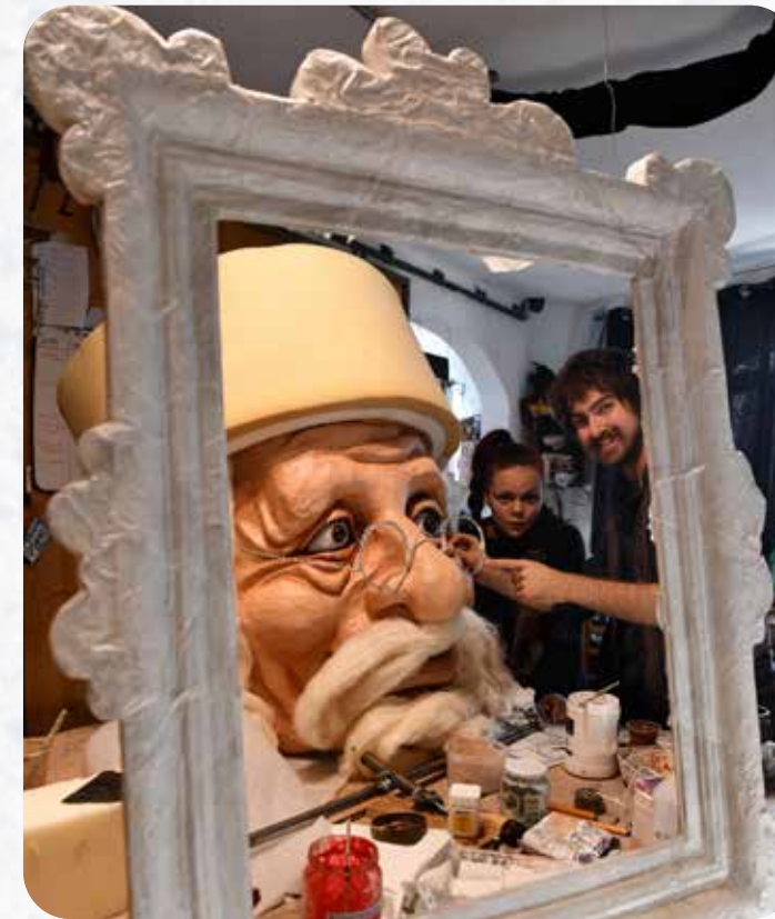
3,50 m, c'est la taille du Père Noël fabriqué par la Cie Deraïdenz.

Dès le 3 décembre, c'est tout un monde enchanté, accessible gratuitement, qui s'ouvrira dans le centre-ville jusqu'au 1 er janvier : la Crèche provençale et le Village des Santonniers et des artisans à l'église des Célestins, le manège des Chaises volantes place des Corps-Saints où la mini-ferme sera également installée, le Paysage féérique place Saint-Didier et le petit train qui vous conduira quatre jours par semaine de place en place.