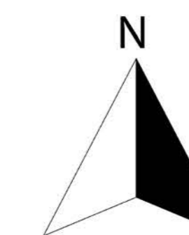
Planche n°9 - Plan du patrimoine bâti et végétal