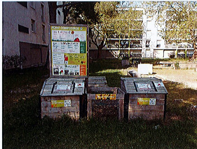
Dimensionné pour 20 à 30 foyers

Il existe différentes formes de composteurs, les dimensions peuvent varier selon le fabricant.