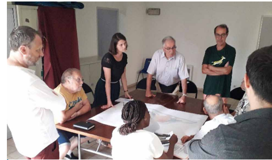
Travail en atelier sur le Règlement Local de Publicité

Cette étape a fait l'objet de réunions dans les quartiers auxquelles étaient conviés les conseillers de quartier mais également les Avignonnais et Avignonnaises de la réserve citoyenne. Après une présentation du diagnostic et des orientations, les personnes présentes ont pu travailler en atelier sur les pistes règlementaires à privilégier par quartier ou secteurs de la Ville.