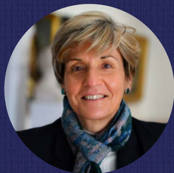
Cécile Helle Maire d'Avignon